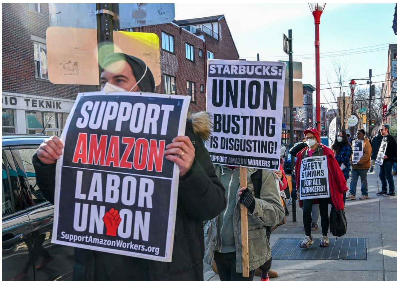
Trabalhadores em campanha de sindicalização em Filadélfia, Estados Unidos.